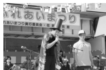
11月 花岡ふれあいまつり