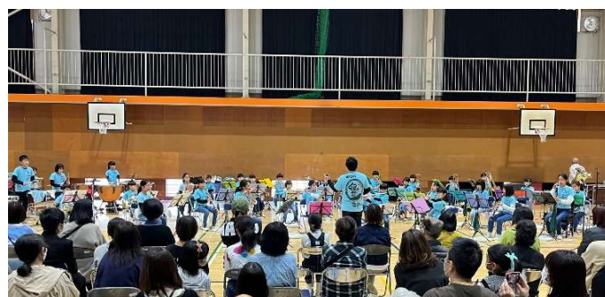
『ケルト民謡による組曲』を演奏する花岡小吹奏楽部