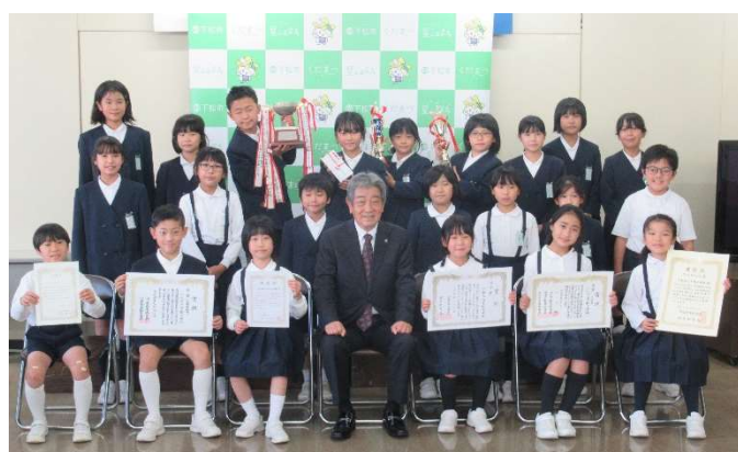
国井市長を囲んで記念撮影

下松小学校吹奏楽部 28 名が、令和 4 年 11 月 19 日に大阪城ホールで開催される第 41 回全日本小学生バンドフェスティバル全国大会の出場に向け、11 月 4 日に国井市長への表敬訪問を行いました。