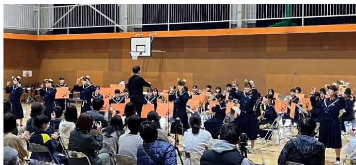
きつねダンスで会場を盛り上げる末武中吹奏楽部

花岡ふれあい音楽祭が令和4年11月20日に花岡小学校体育館で開催されました。公民館講堂建替え工事のため中止した花岡ふれあい公民館まつりの代わりとして、花岡小、末武中、華陵高校の吹奏楽部をはじめ、地域の団体による和太鼓演奏や花岡小ダンスクラブの披露がありました。