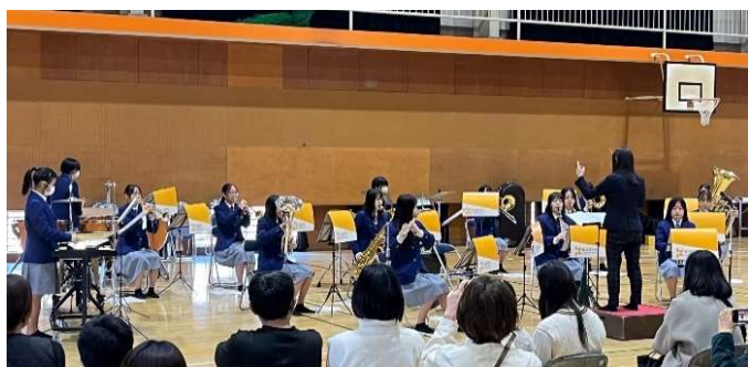
華陵高校吹奏楽部は、少人数ながら力強く、息のあった演奏でした

花岡小吹奏楽部は、コンクールやバンドフェスティバル中国大会で演奏した『ケルト民謡による組曲』というアイルランドに古くから伝わる民謡をテーマにした楽曲を披露しました。